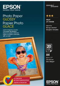
Photo Paper Glossy